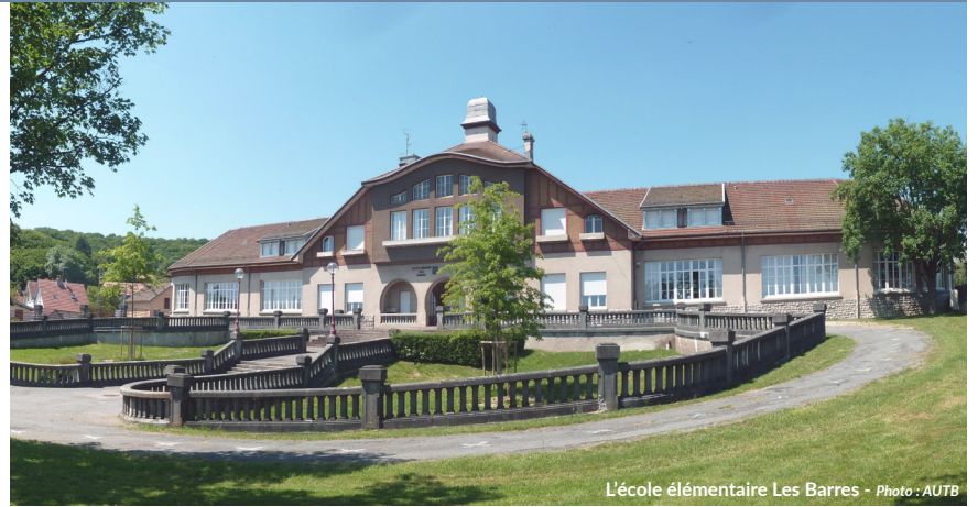
L'école élémentaire Les Barres - Photo : AUTB

Maître d'ouvrage Ville de Belfort Référent / Contact Pédro Hermenegildo / phermenegildo@autb.fr Accès Transmis à la Ville de Belfort