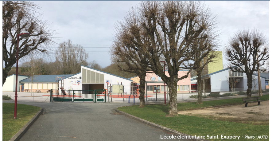
L'école élémentaire Saint-Exupéry - Photo : AUTB