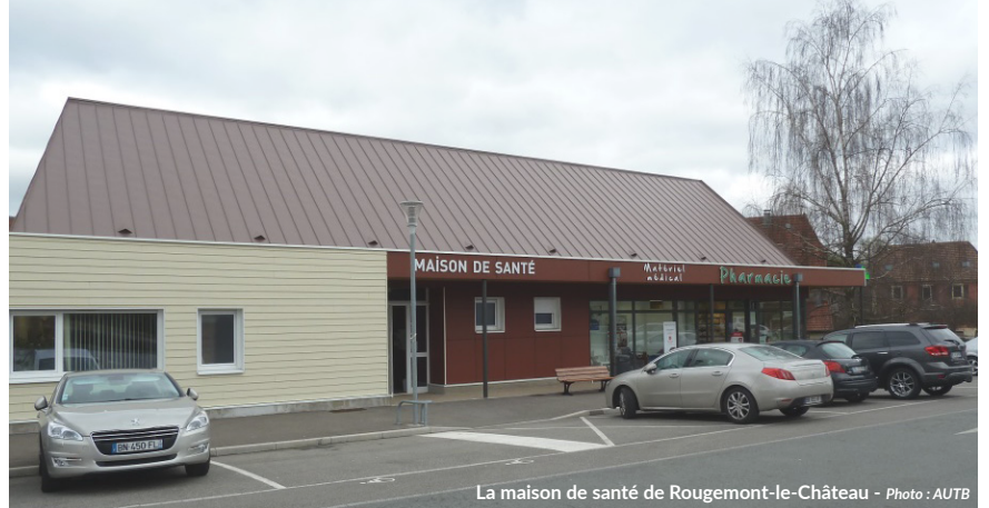
La maison de santé de Rougemont-le-Château

Partenaire Pôle métropolitain Nord Franche-Comté Coopération AUTB-ADU Support / Format PDF - 16 pages Réfèrent / Contact Anne Quenot / aquenot@autb.fr Pédro Hermenegildo / phermenegildo@autb.fr Accès téléchargeable sur www.autb.fr > productions / équipements et services