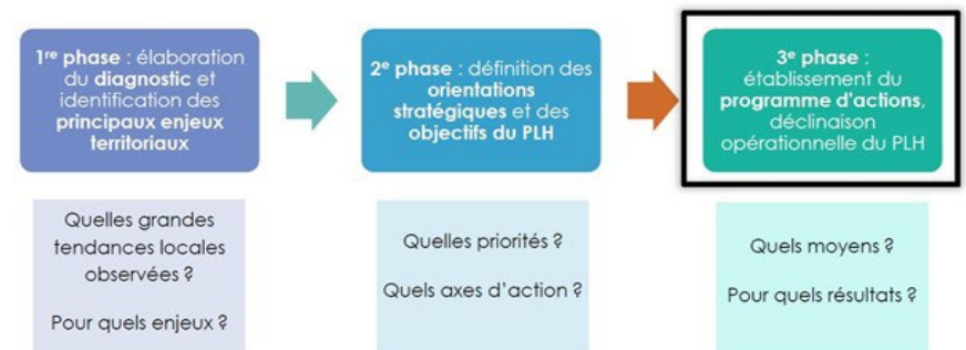
Schéma d'élaboration du PLH

Lors du comité syndical en date du 21 mai 2024, les élus ont donné un avis défavorable à la 1 ère modification du SRADDET en dénonçant notamment la méthode déployée par la Région pour déterminer le taux d'effort à l'échelle du Nord Franche-Comté. Ce taux laisse en effet très peu de marge de manœuvre au territoire du SCoT, pourtant amené à jouer un rôle important dans la réindustrialisation nationale.